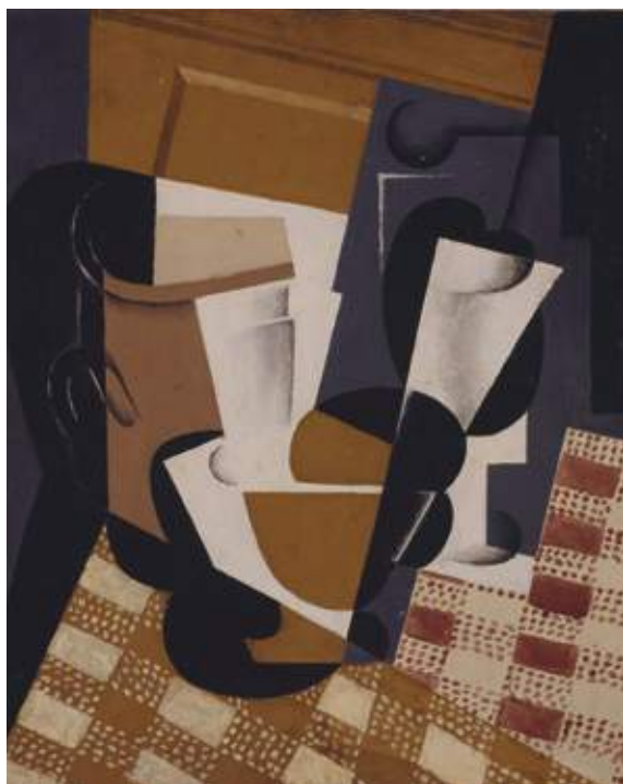
Juan Gris (1887-1927). "Jarra y vaso", 1916. Óleo sobre tabla. Museo Reina Sofía.

Para los más pequeños se organizaron 21 talleres infantiles para cerca de 500 hijos de mutualistas , en ocasiones acompañados por sus padres, con los siguientes títulos: Si fuera un movimiento , Salto al vacío , Escenarios improbables y los de nueva creación ¡ Antorcha!