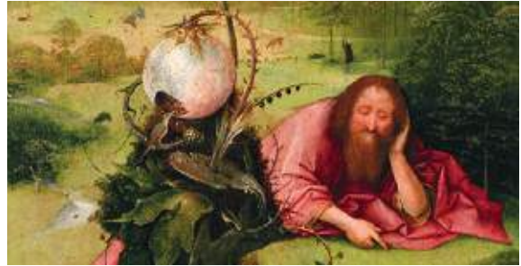
Hieronymus Bosch, "El Bosco" (1450-1516). "Meditaciones de San Juan Bautista", 1485-1510. Museo Lázaro Galdiano.

En 2019 los mutualistas han podido visitar gratuitamente el Museo Lázaro Galdiano con un acompañante presentando su tarjeta SOY en taquilla, así como disfrutar de visitas guiadas y talleres familiares. Además, hijos de asegurados han tenido la oportunidad de asistir a campamentos de día en el museo durante las vacaciones estivales. Cerca de 11.000 mutualistas y sus acompañantes han acudido al museo.